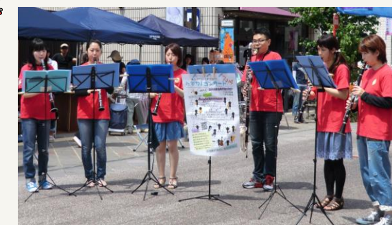
▲歩行者天国となった桜町本通りで演奏する「西三河ウィンドオーケストラ」の皆さん

6月8日(日)の青空イベントには、崇化館交流館で活動している「西三河ウィンドオーケストラ」が出演し、「アナと雪の女王」の挿入歌等の演奏で会場は大きな歓声が湧きました。