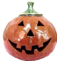
▲交流館ロビーに見本展示中