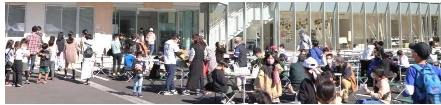
飲食コーナー おだやかな秋晴れに恵まれました