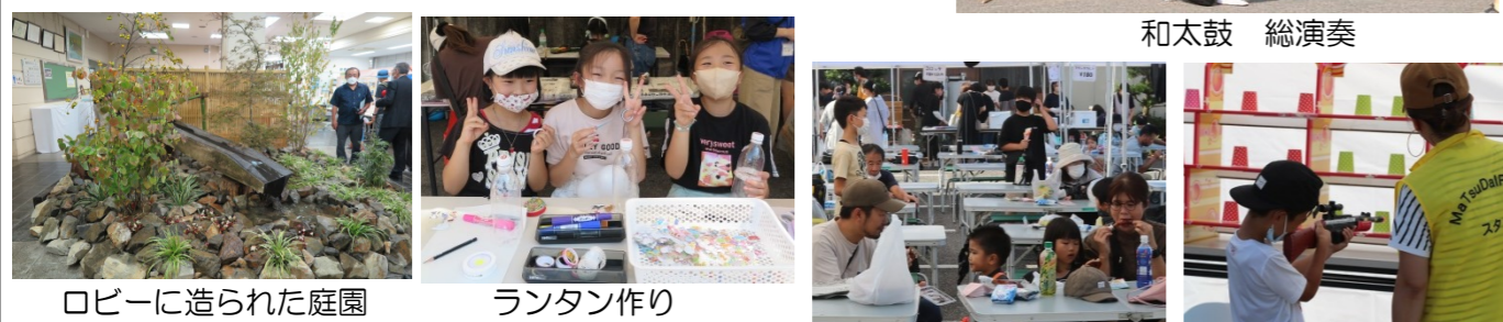
ロビーに造られた庭園 ランタン作り マルシェコーナー 射的