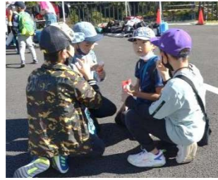
ねえ、次どこに行く？