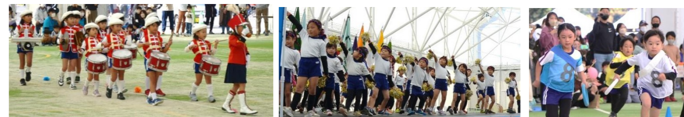
鼓隊演奏 松平大和幼稚園 リズム 松平こども園 園児対抗リレー