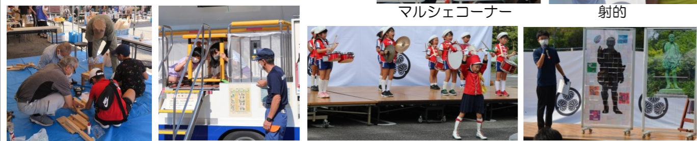
アイス作り 防サイ君 鼓隊 松平大和幼稚園 みんなで作った親氏公