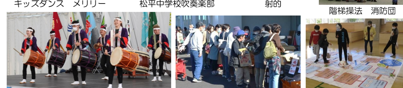
和太鼓演奏 松平わ太鼓 激安バーゲン 防災すごろく