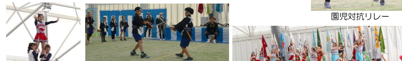
棒の手演技 フラダンス ハーロー・オフィ・ロカビ