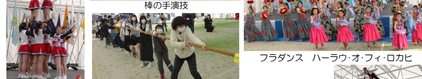
中京大学チアリーディング 小中学生綱引き