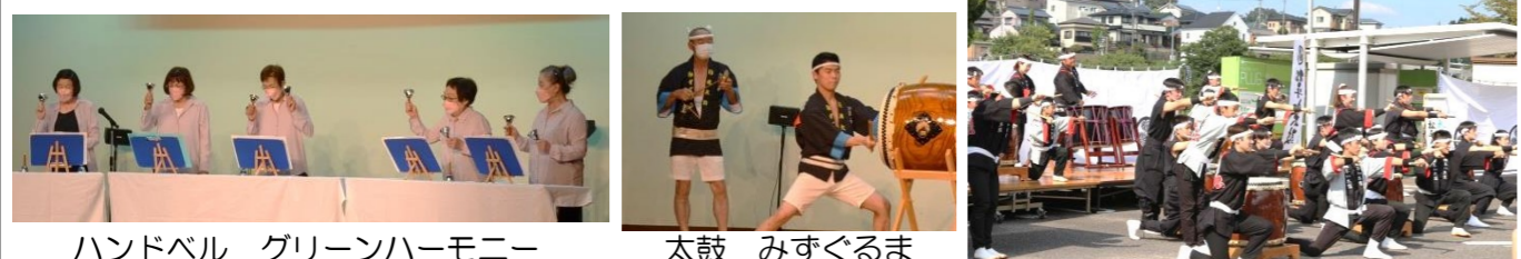
ハンドベル グリーンハーモニー 太鼓 みずぐるま 和太鼓 総演奏