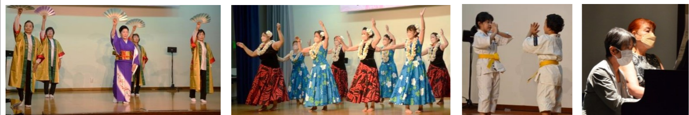
新進流 葵会 フラダンス ノホマリエ 少林寺拳法 ピアノ ダ・カーポ