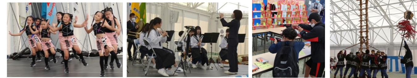
キッズダンス メリリー 松平中学校吹奏楽部 射的