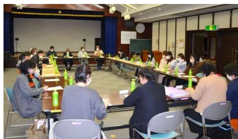
二十歳のつどい実行委員会

まだまだコロナの脅威は収まっていませんが、松平交流館祭や松平わくわくフェスタが、みなさんのお力で、元のような賑わいを取り戻して開催されました。新しい年は、もっともっと前向きな気持ちで、地域の中のふれあいの機会が増えていくといいなあと思います。