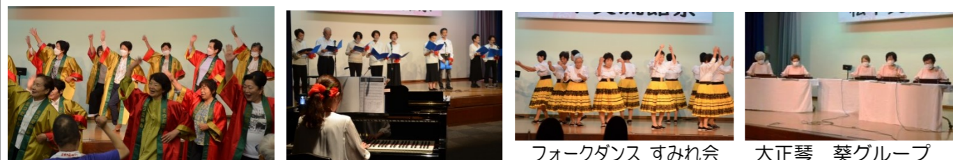
舞踊 松平高齢者クラブ連合会 合唱 ドレミの会 フォークダンス すみれ会 大正琴 葵グループ