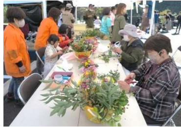
アレンジフラワー