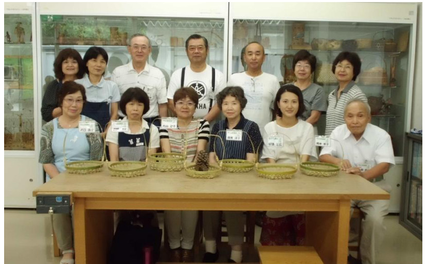
受講者：6名 講師：石野竹工芸グループ